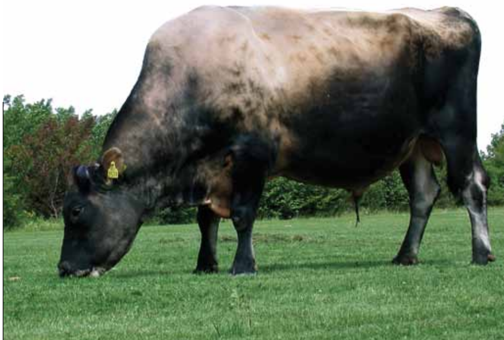
Karakteristisk for aAa-avlssystemet er, at der også kigges meget på tyrenes kropsbygning. Den grundlæggende idé er her, at der skal bruges tyre, der kan opveje de egenskaber og kvaliteter, som den enkelte ko mangler, for at få afkom, der præsterer bedre.

- At aAa-avlssystemet spiller en rolle, også i Danmark, illustreres ikke mindst af, at kvægavlsforeningerne angiver aAa-analysenumre for deres tyre. Årsagen er, at mange landmænd efterspørger dette for at ville bruge tyrene, hævder Joost van der Horst.